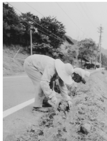
上組「はこべグループ」

現在この上祖山を離れている方でも「定年になったら帰ろう～上祖山に！」と思われるような地区を目指していきたいと思えます。（寄稿）