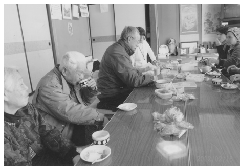
楽しい「おしゃべりサロン」

区の総会には1世帯1名が出席し、年間の行事及び予算等の資料を全戸配布していますが、月ごとの予定を回覧で知らせる。義務人足の出不足金、伍長手当の見直し等、地区の現状を鑑み、住んでいる人が住みやすい地区を目指して、みんなで協力している地区です。（編集委員）