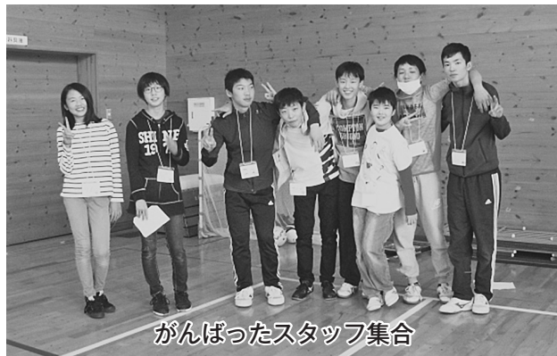
がんばったスタッフ集合

「令和の始まりに名を残そう！」8回目の子どもフェスティバルのテーマです。勢いのある素晴らしいテーマですね、それぞれの競技にも種目名がちゃんとあります。大人の発想ではとても思い浮かびません。今年の実行委員さんは男子4名から始まり徐々に増えて小6女子も加わえた8名で企画から当日まで5回の会議を重ねてきました。市内他地区でも同じ様な事はしているが、子供達が企画に加わる事はないようです。