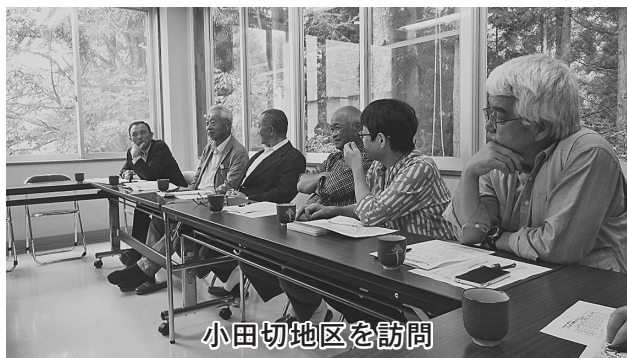
小田切地区を訪問