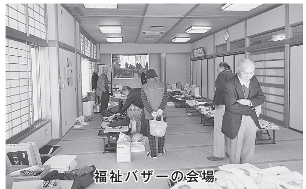
福祉バザーの会場