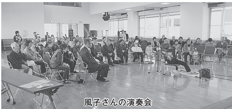
風子さんの演奏会