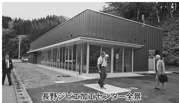
長野ジビエ加工センター全景

10月4日（金）に第1回地域振興委員会視察研修会が行われ、9名の委員が参加し、小田切地区住民自治協議会と中条にある長野ジビエ加工センターを訪問して来ました。