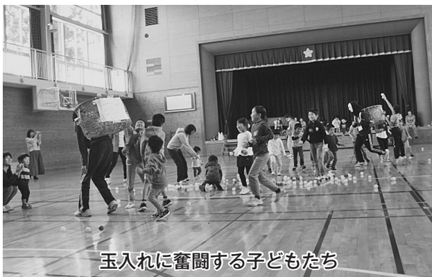
玉入れに奮闘する子どもたち