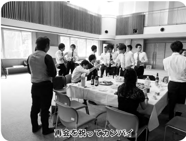
再会を祝ってカンパイ