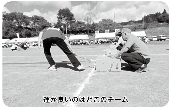
運が良いのはどこのチーム