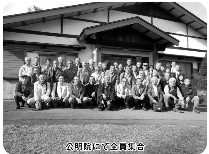
公明院にて全員集合

10月2日(火) 古里地区から25名の方を迎え地域間交流事業が行われました。古里住民自治協議会は三才駅付近とその東側の駒沢・金箱・富竹の市民病院がある地区で人口13,700人とのことです。