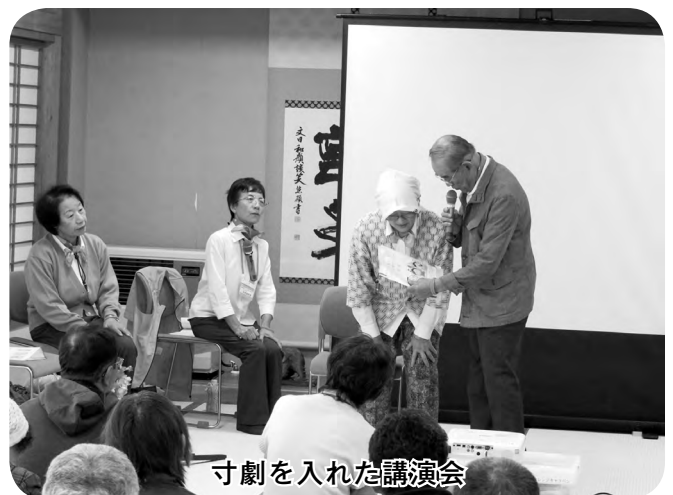
寸劇を入れた講演会

この度、健康福祉委員になり福祉の事業に何度か参加させて頂きました。平成20年から地域助け合い事業「家事援助、福祉移送」の協力会員として10年以上尽力された方の表彰、他に大勢の協力会員の登録者がいたことは驚きと、その反面素晴らしいことだと思いました。