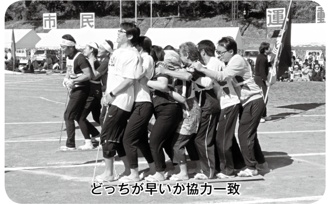
どっちが早い協力一致