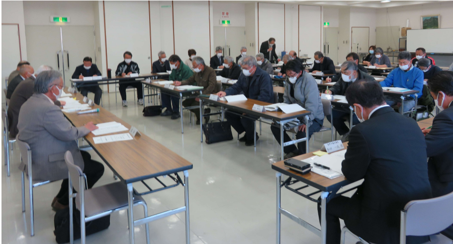
令和5年度評議委員会総会